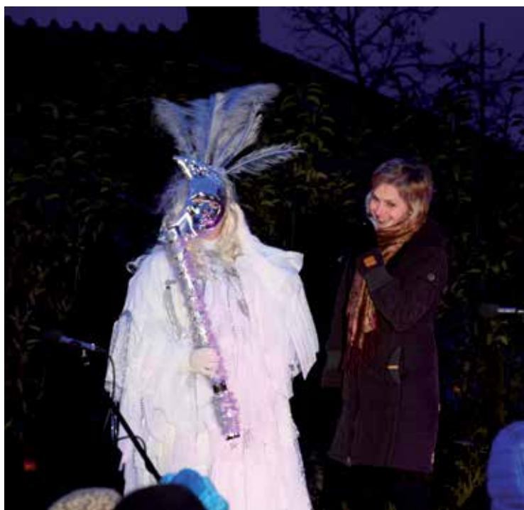
Rozsvěcování vánočního stromu.