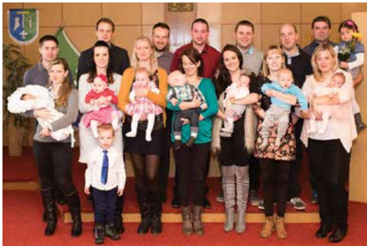
Vítání občáňků.